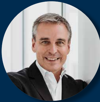
Claude Meisch Bildungsminister